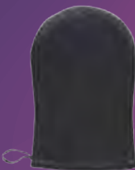
Luva Aplicadora R$ 35,20 cada