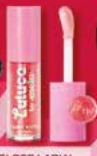
GLOSS LABIAL LULUCA BY MELU FAIRY GLITZ