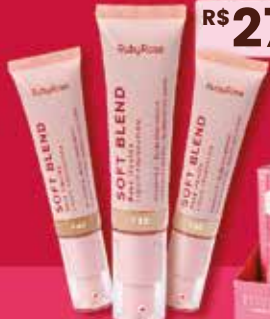
BASE LÍQUIDA SOFT BLEND RUBY ROSE R$ 27,99 cada