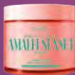
Hidratante Corporal Body Cream Amalfi Sunset 200g R$ 109,99 cada