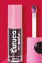
GLOSS LABIAL LULUCA BY MELU MAGIC VIOLET R$ 36,99 cada